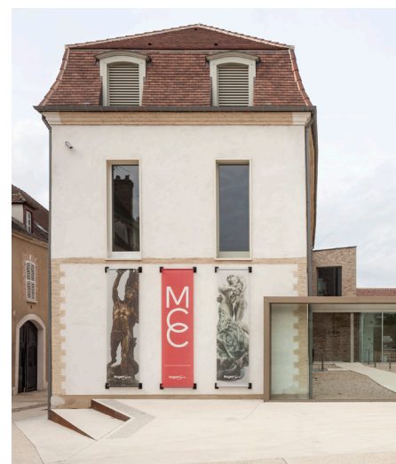
Le musée Camille Claudel